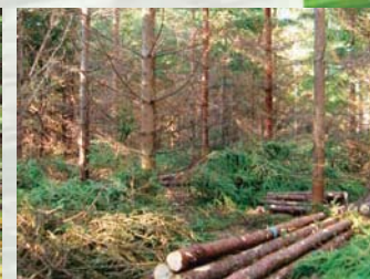
AVANT ET APRÈS DES TRAVAUX D'ÉCLAIRCISSEGE.